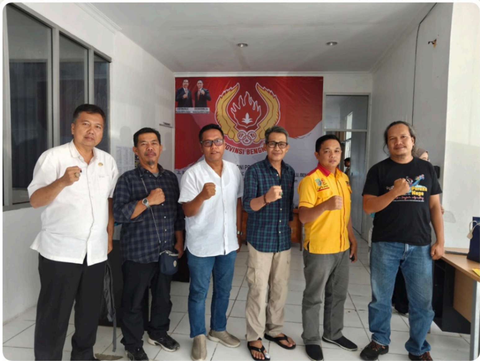
Koordinasi dgn KONI Prov. Bengkulu terkait Pendirian PGPI Bengkulu